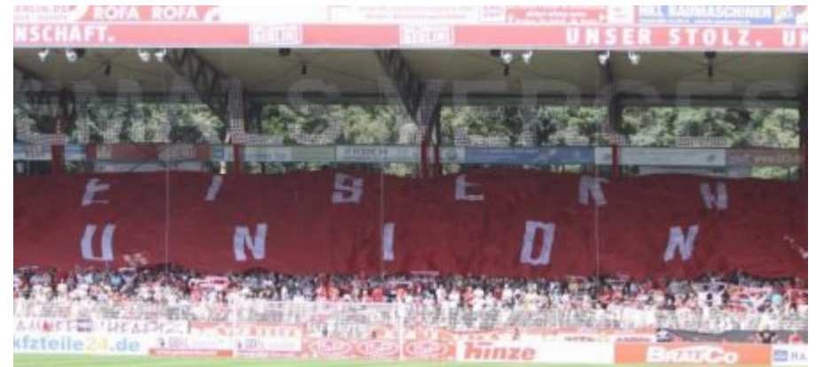
Intro gegen die Fortuna...